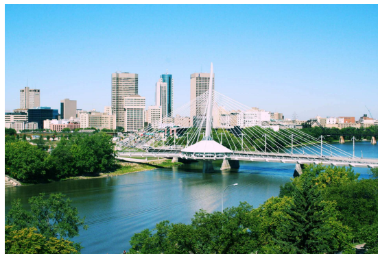
Esplanade Provencher. Points de vue entre St-Boniface et Winnipeg

Vous connaissez Winnipeg, la capitale du Manitoba et Saint-Boniface, le château fort de la francophonie dans l'Ouest canadien. Les amateurs de géographie, d'histoire du Canada savent bien qu'avant de s'appeler St-Boniface, situé à la fourche de deux grandes rivières, La Rouge et de L'Assiniboine, que ce territoire s'appelait Fort Rouge .