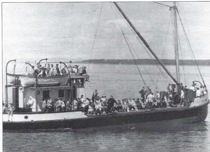
À gauche l'épave du Claudia (1943) et à droite, le M.V. Trois-Pistoles (1944-1961).