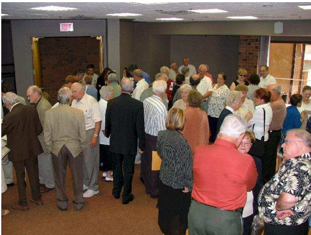
Environ 140 personnes se sont présentées à l'inscription de ce rassemblement de 2004 à Gatineau.