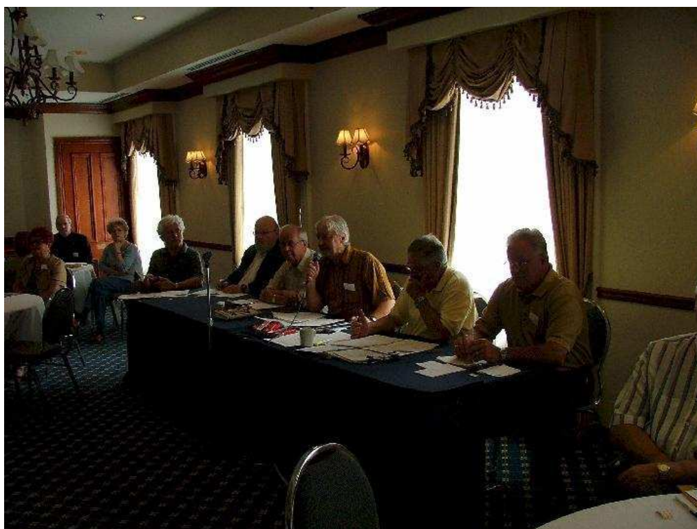
L'assemblée générale à Gatineau : Le conseil d'administration fait le bilan de ses activités de 2003.