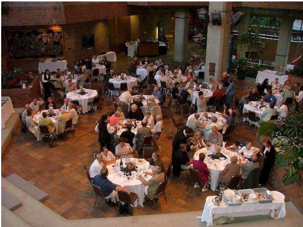
L'ensemble des convives. Une fois de plus, les d'Amour(s) ont su se réunir. Félicitation au comité organisateur de ce rassemblement.