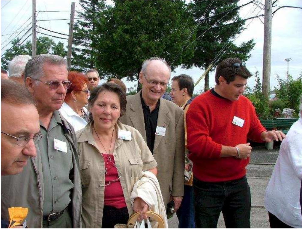
L'embarquement se fait : Le trajet aller-retour, en train à vapeur, de Hull à Wakefield dure environ 4h30. Cette excursion a été un véritable enchantement.