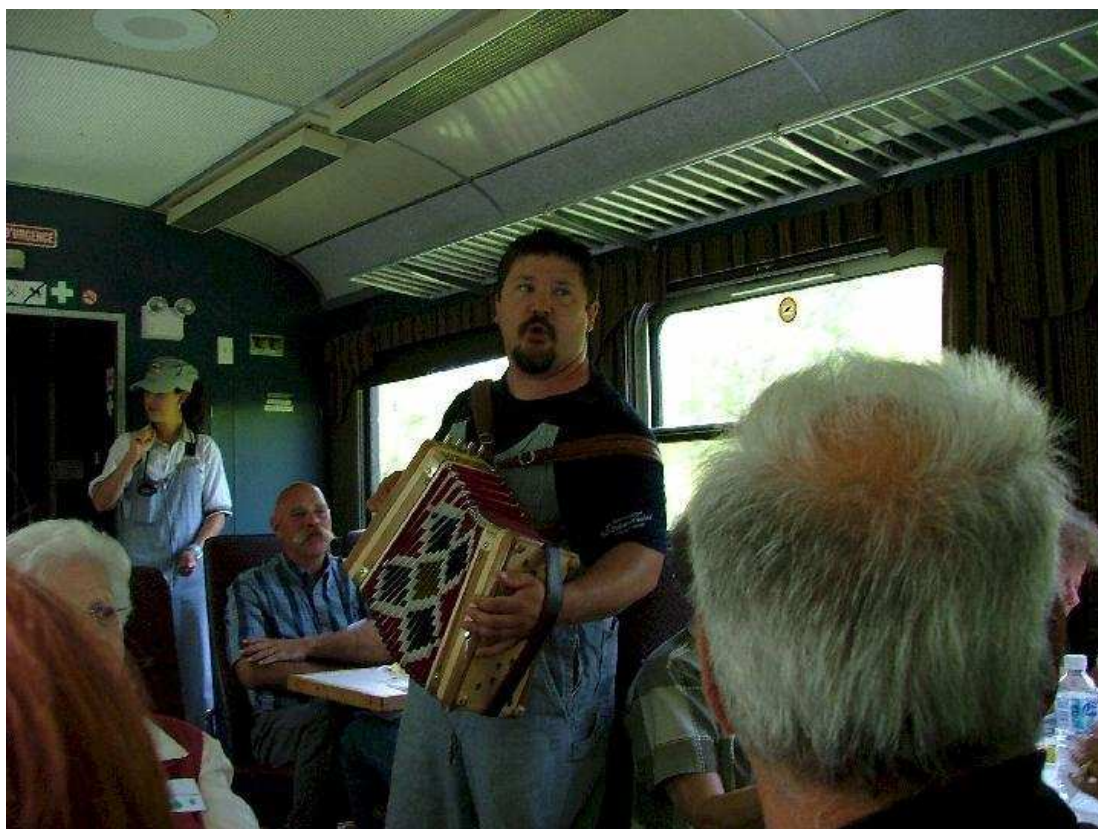
Il n'y avait pas que des conversations . L'accordéoniste accompagnait les passagers. Il a répondu également à quelques demandes des excursionnistes.