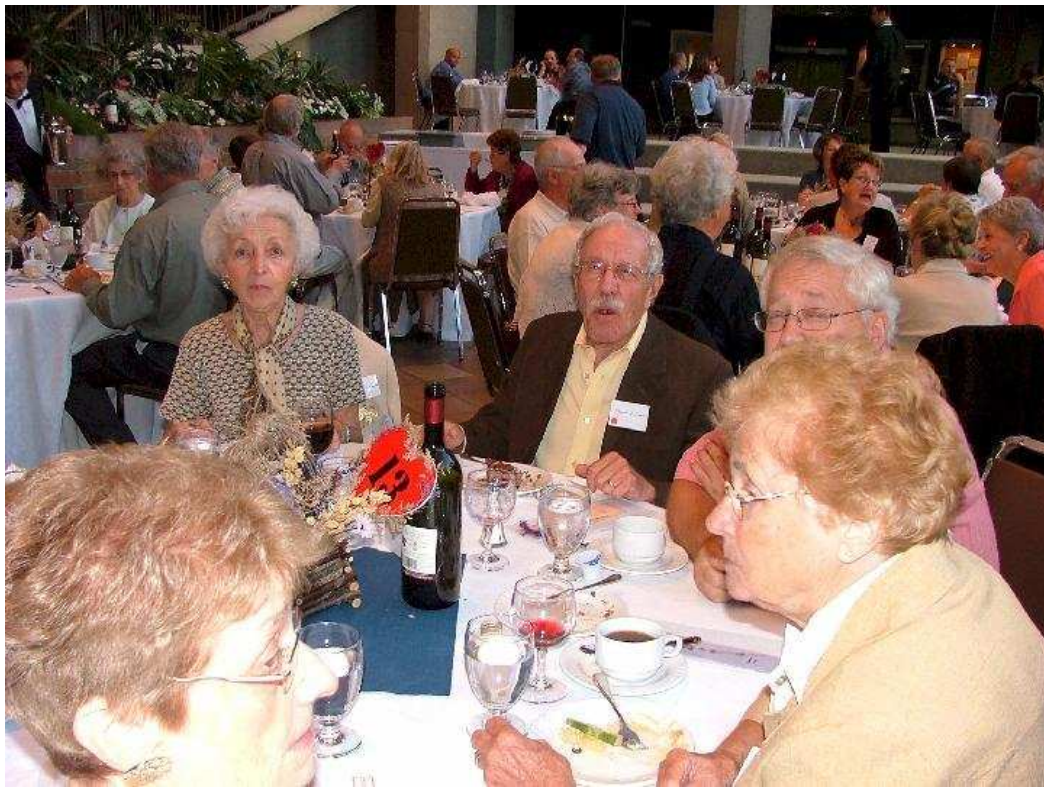
Une des nombreuses tablées de D'Amour(s).