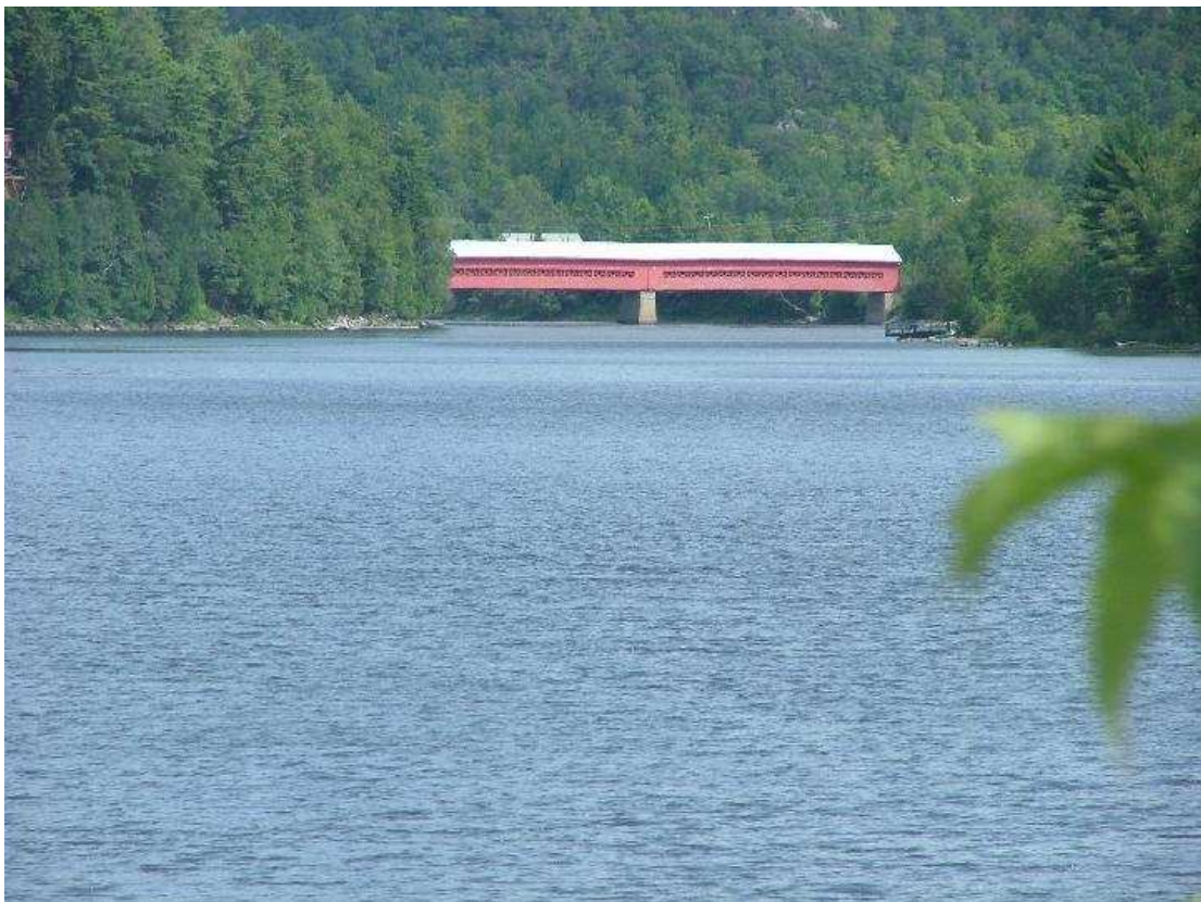
Un pont couvert, une relique des temps qui ne sont pas si loin.