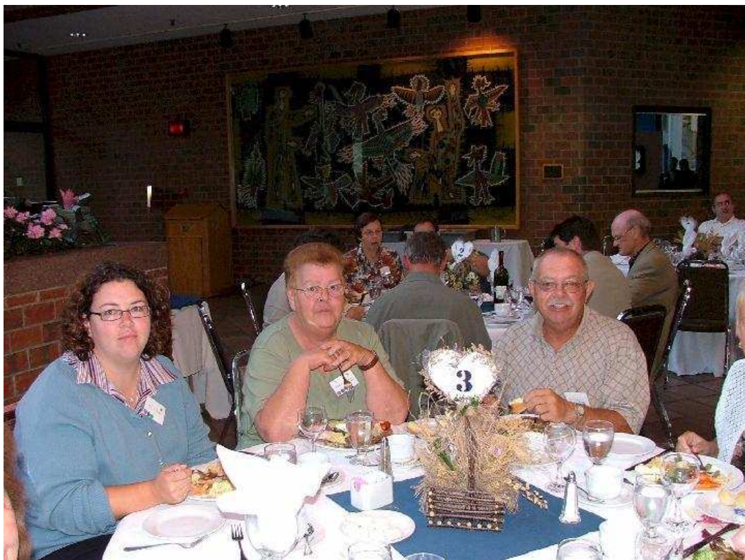
Le Banquet avait lieu à la Maison du citoyens de Hull-Gatineau. C'est à l'occasion de ce rassemblement que l'Association des Familles D'Amours lançait son dictionnaire généalogique.