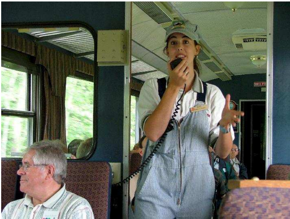
L'animatrice fut exceptionnelle , son sourire et son verbe a enchanté les voyageurs de son wagon .