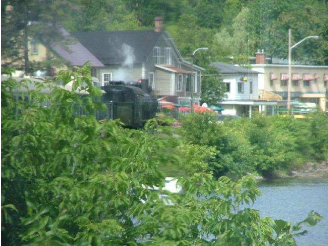
Le train de Wakefield traversant la campagne quelques minutes avant son arrivé à Wakefield.